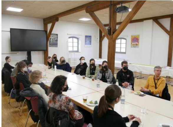
Meet the Prof