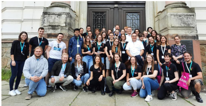
Konferenzen und Symposien