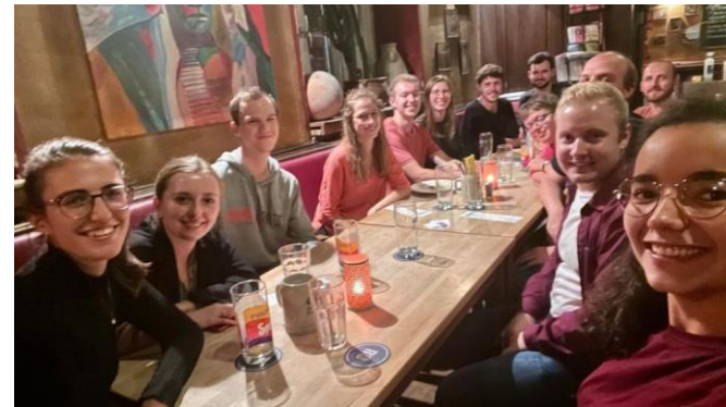
Treffen der Stadtgruppen